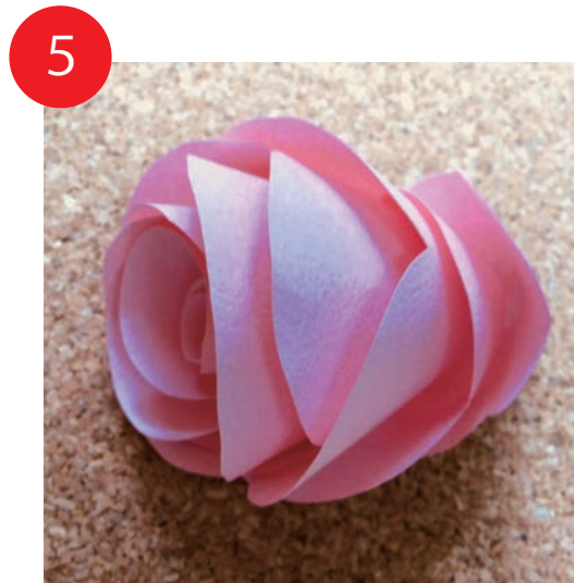
5 最後まで巻きおえると上のようになります