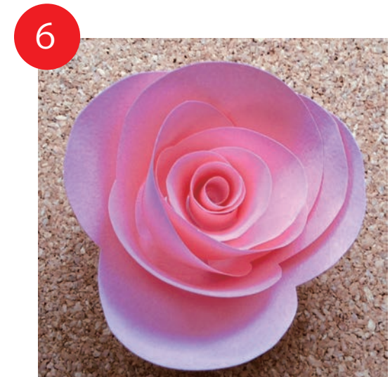
6 底の部分を両面テープで貼り形を整えて完成です