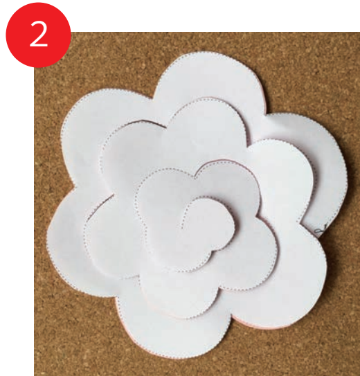
2 切りおえると上のようになります