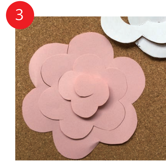
3 型紙をとりのぞきます