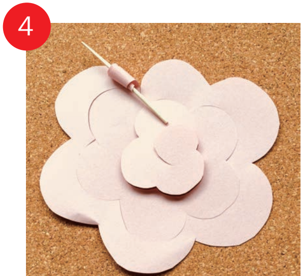
4 つまようじを用いて外側から巻いていきます